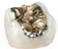
Precisie goudinlay vervaardigd in het tandtechnische laboratorium

Gouden inlays in de zijtanden zijn een goede, langdurige oplossing die door het lichaam goed aanvaard wordt. De natuurlijk tand wordt door het gouden inlay nagebootst. Zelfs het kauwvlak wordt in detail individueel nageemaakt, zodat een optimale kauwfunctie gewaarborgd is. Het gouden inlay is een precieus werk van de tandarts en de tandtechnicus.