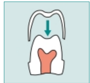
Grafiek: Tandrestauratie door een kroon.

Met een galvano-kroon kiest u een kwalitatief prima restauratie, die biologisch goed verdraagzaam is. Optimale precisie, lange houdbaarheid en natuurlijk uitzicht zijn verdere voordelen van de gelvano-kroon.