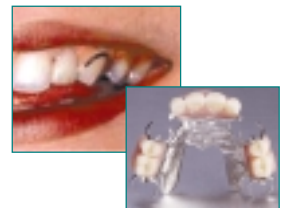
Klammerprothese - einfache Lösung bei fehlenden Zähnen

Als er meer tanden verloren zijn gegaan krijgt u van het zienfonds vaak een prothese met klemmen om de ontbrekende tanden te vervangen. Deze eenvoudige en doeltreffende oplossing heeft echter nadelen: de zichtbare klemmen zien niet esthetisch uit, er kunnen problemen met het tandvlees ontstaan en de klemmen kunnen de gezonde tanden beschadigen.