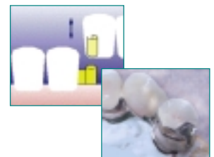
Beispiel: Geschiebe als Verbindungselement für den kombinierten Zahnersatz

Als de resterende tanden nog een stabiele wortel hebben, presenteert zich als een zeer comfortabele, zekere en esthetische oplossing een zogenaamd gecombineerd gebit. Dit zit vast en is toch uitneembaar. Om te bereiken dat dit goed vastzit, worden gezonde tanden van een vastzittende kroon voorzien. In de kroon worden zeer nauwkeurige en goed functionerende (fijn) mechanische verbindingselementen verwerkt, bvb. een uitschuifbaar deel, (grendeltje) of een drukknopanker. Door de verbindingselementen wordt de prothese met het restgebit verbonden, maar blijft uitneembaar.