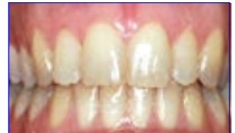
gelige tanden voor het bleken

Bij het bleken zijn, verschillend van intensiteit, meerdere nuances van witter worden mogelijk. Tijdens en na het bleken kunnen de tanden korte tijd wat overgevoelig zijn. Denkt u eraan dat het bleken van uw tanden in handen van de vakman hoort. Bleken is primair een cosmetische behandeling, die niet door het ziekenfonds wordt terugbetaald. De bleekmiddelen die in de handel vrij te verkrijgen zijn worden uit voorzichtigheid afgeraden. Bij het bleken moeten wij speciaal letten op de geneeskundige aspecten. Graag informeren wij u over een goede en zekere methode van bleken.