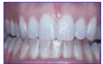
een duidelijk verschil na het bleken