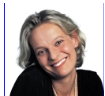
keramische brug in de mond, een esthetisch mooie oplossing