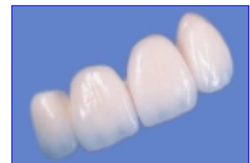
natuurlijke esthetiek van een volkeramische brug