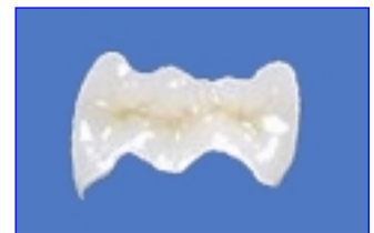
Precisieporseleinlay uit het tandtechnische laboratorium.

Keramische inlays voor de kiezen zijn een goede, esthetische en lichaamsvriendelijke oplossing. Ze worden naar vorm en kleur van de natuurlijke tanden gemaakt. Zelfs het kauwvlak wordt individueel en met liefde voor detail nagebootst zodat de optimale kauwfunctie gewaarborgd blijft.