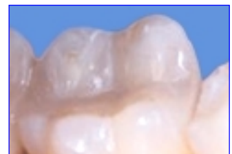
geplaatst porseleinlay als vulling onherkenbaar

Het keramische inlay is een precisie-werk van de tandarts en de tandtechnicus. Ieder inlay is een unicum door de individuele kleur en de nauwkeurige mogelijkheden bij de verwerking, is deze in de mond praktisch onzichtbaar. Een keramisch inlay is uiterst geschikt voor een verzorging in het zichtbare gedeelte van de mond.